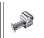
Optionals pag. 173