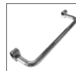
Optionals pag. 174

ACCESSORI DISPONIBILI A RICHIESTA OPTIONALS AVAILABLE ON REQUEST ДОПОЛНИТЕЛЬНЫЕ ОПЦИИ